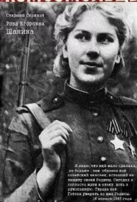
Старший Сержант Роза Егоровна Шанина

Я знаю, что ещё мало сделала, но больше, чем обязана как советский человек, встану на защиту своей Родины. Сегодня я согласна идти в атаку, хотя в ружьишину. Страха нет. Готова умереть во имя Родины. 16 января 1945 года