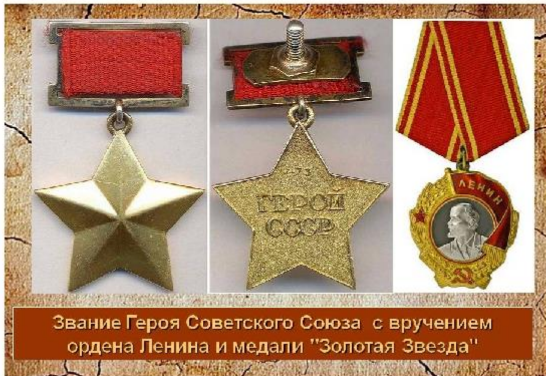
Звание Героя Советского Союза с вручением ордена Ленина и медали "Золотая Звезда"