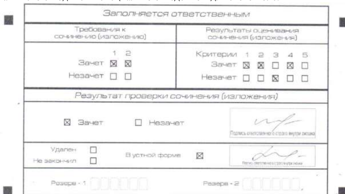
Рис. 9. Область для оценки работы сочинения (изложения) в устной форме

После окончания заполнения бланка регистрации ответственное лицо ставит свою подпись в специально отведенном для этого поле.